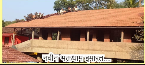
नवीन भक्तधाम इमारत....