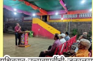
महाशिवरात्र उत्सवापूर्वीची जनरलसभा..