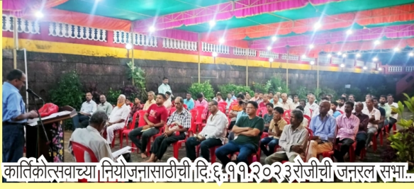
कार्तिकोत्सवाच्या नियोजनासाठीची दि.६.११.२०२३ रोजीची जनरल सभा..