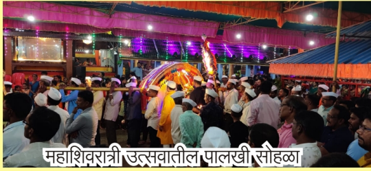
महाशिवरात्री उत्सवातील पालखी सोहळा