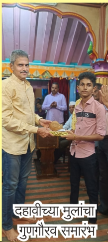
दहावीच्या मुलांचा गुणमौख समारंभ