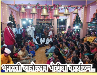
भगवती यात्रोत्सव भेटीचा कार्यक्रम..