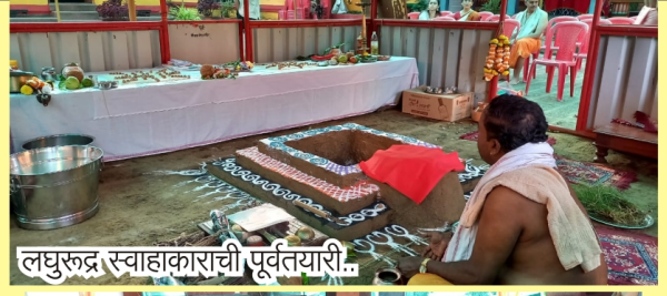
लघुरुद्र स्वाहाकाराची पूर्वतयारी..