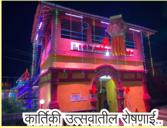
कार्तिकी उत्सवातील रोषणाई..