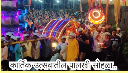
कार्तिक उत्सवातील पालखी सोहळा..