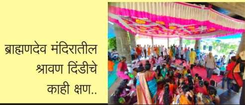
ब्राह्मणदेव मंदिरातील श्रावण दिंडीचे काही क्षण..