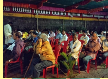
महाशिवरात्र उत्सवापूर्वीची जनरलसभा..