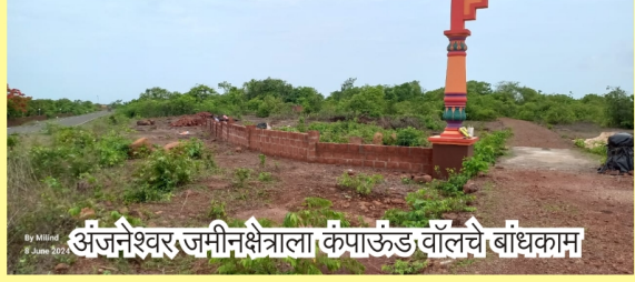
अंजनेश्वर जमीनक्षेत्राला कंपाऊंड वॉलचे बांधकाम