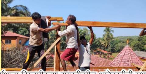
धर्मशाळा विस्तारीकरण इमारतीवरील आडेकाठीची स्थापना