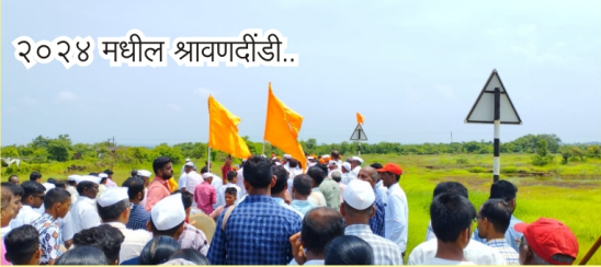
२०२४ मधील श्रावणदींडी..