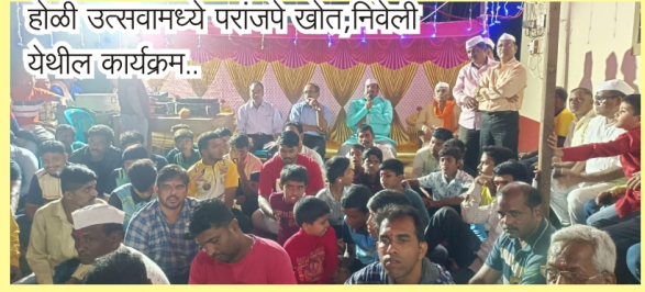
होळी उत्सवामध्ये परांजपे खोत, निवेली येथील कार्यक्रम..