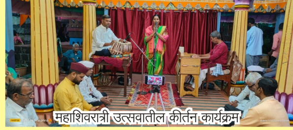
महाशिवरात्री उत्सवातील कीर्तन कार्यक्रम