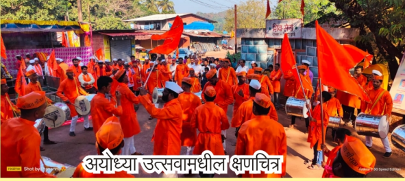
अयोध्या उत्सवामधील क्षणचित्र