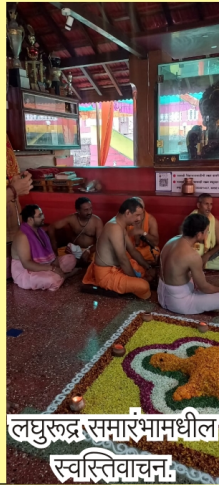
लघुरुद्र समारंभामधील स्वस्तिवाचन.