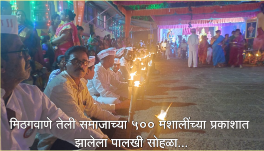
मिठगवाणे तेली समाजाच्या ५०० मशालींच्या प्रकाशात झालेला पालखी सोहळा...