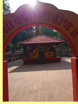
श्रीदेवी भराडणी मंदिरामध्ये सर्व सुधारणा करण्यात आल्या...