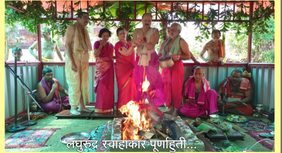
लग्नुरुद्र स्वाहाकार पूर्णाहती...