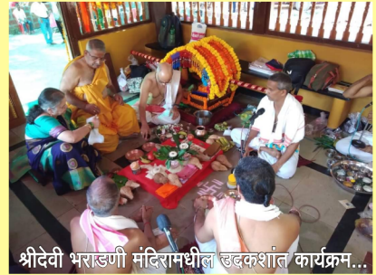
श्रीदेवी भराडणी मंदिरामधील षडकशांत कार्यक्रम...