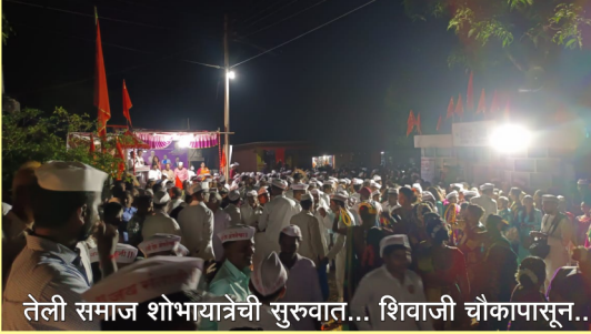
तेली समाज शोभायात्रेची सुरुवात... शिवाजी चौकापासून...