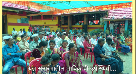
यज्ञ समारंभातील भाविकांची उपस्थिती...