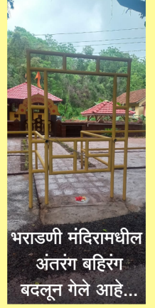
भराडणी मंदिरामधील अंतरंग बहिरंग बदलून गेले आहे...