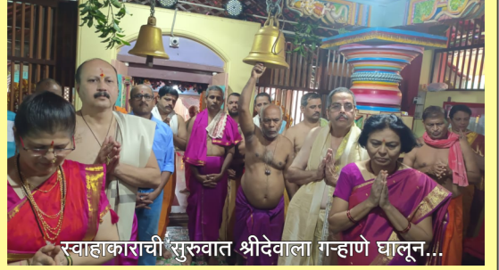
स्वाहाकाराची सुरुवात श्रीदेवाला ग-हाणे घालून...