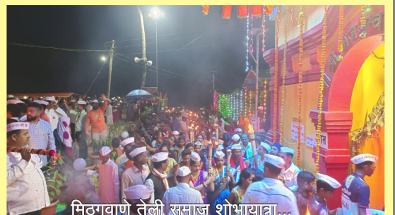
मिठगवाणे तेली समाज शोभायात्रा...