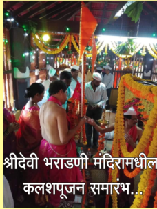
श्रीदेवी भराडणी मंदिरामधील कलशपूजन समारंभ...