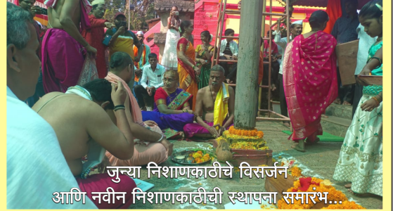
जुन्या निशाणकाठीचे विसर्जन आणि नवीन निशाणकाठीची स्थापना समारंभ...