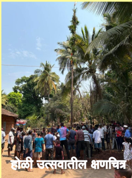
होळी उत्सवातील क्षणचित्र