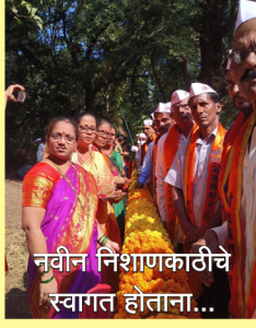
नवीन निशाणकाठीचे स्वागत होताना...