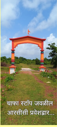
चाफा स्टॉप जवळील आरसीसी प्रवेशद्वार...