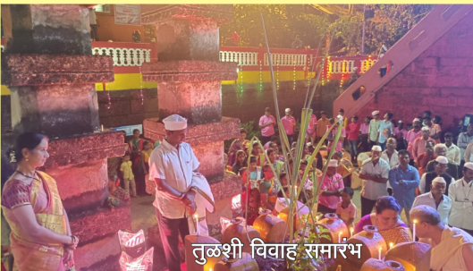
तुळशी विवाह समारंभ