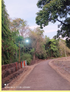
अंजनेश्वर पथदीप योजना राबवून भाविक भक्तांसाठी रात्र प्रकाशाची सोय...