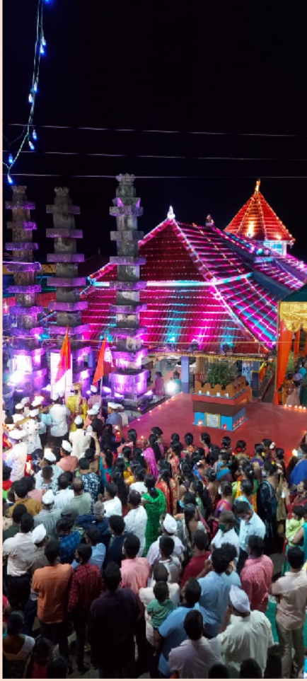
कार्तिकोत्सवातील नेत्रदीपक रोषणाई ....