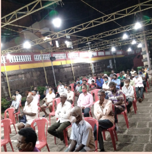
महाशिवरात्री उत्सवापूर्वीची जनरल सभा व त्यामधील उपस्थिती ....