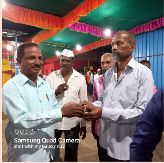
सर्व भाविकांसाठी चहापानाचा कार्यक्रम ....