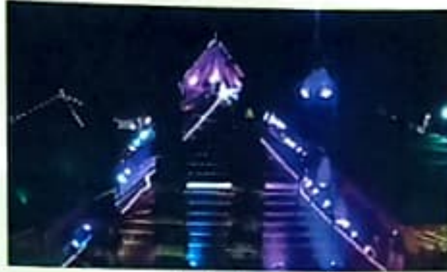
उत्सवातील नेत्रदीपक रोपणाई