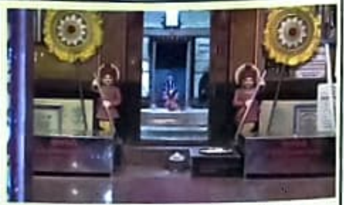
अर्पणदानासाठी बसविलेल्या दोन दानपेट्या...