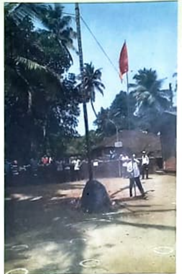
कोरोना कालावधीतील होळी उत्सवातील एक क्षण...