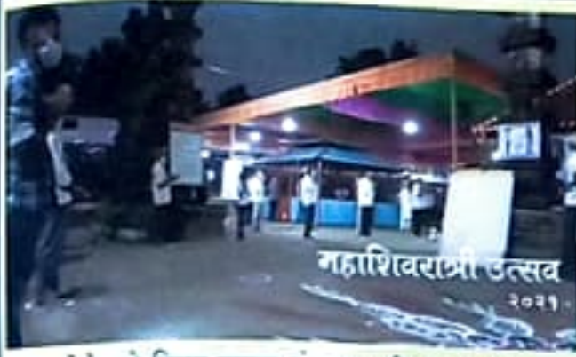
कोरोनाचे नियम पाळून संध्याकाळी ७ वाजता सुरु झालेला महाशिवरात्री उत्सव...