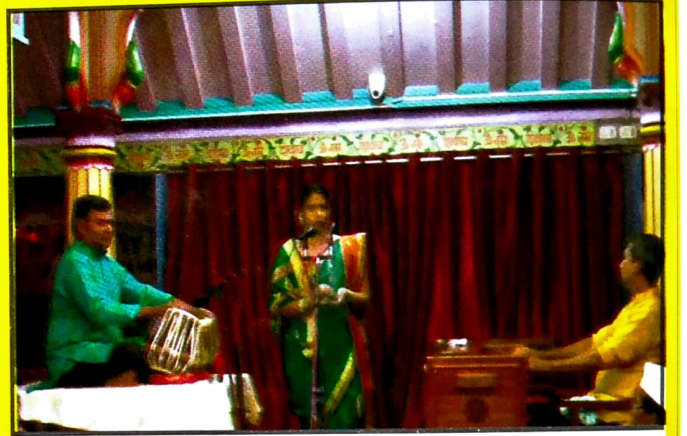
महाशिवरात्री उत्सवामधील ह.भ.प.सौ.वेदश्री ओक, डोंबिवली कीर्तनसेवा सादर करताना..