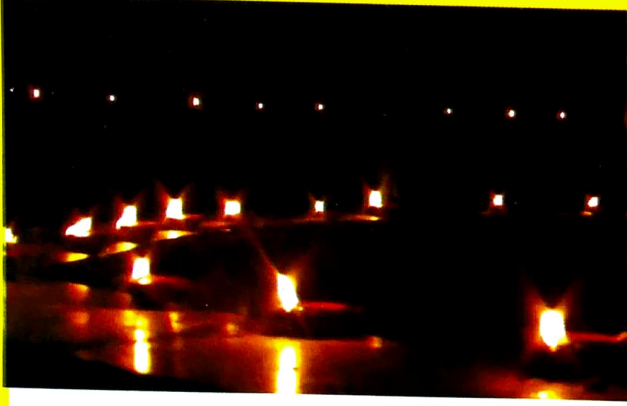
कार्तिकोत्सवातील पणत्यांची रोषणाई...