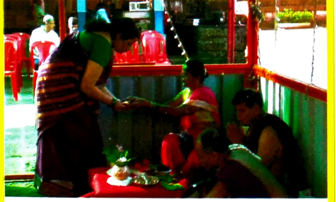
कार्तिकोत्सवातील लघुरुद्र स्वाहाकारातील यजमान पूजन...