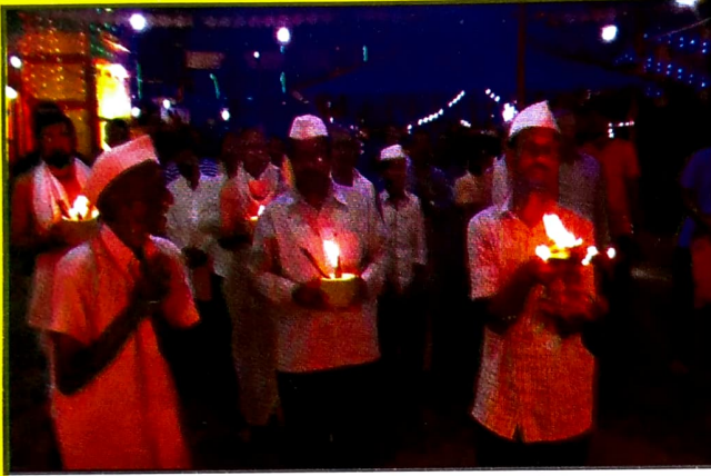
त्रिपुरारी पौर्णिमेला त्रिपुर पूजनापूर्वीची मंदिर प्रदक्षिणा..