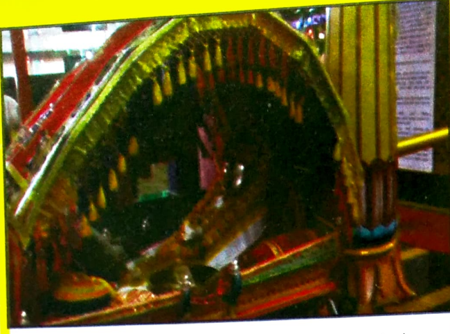
पालखीत विराजमान असलेले श्रीदेव भवानीशंकर अंजनेश्वर...