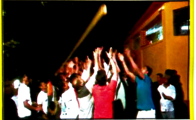
वार्षिक होळीचा कार्यक्रम... होळी गावातील खेळगड्यांचे 'होळी खेळवणे'