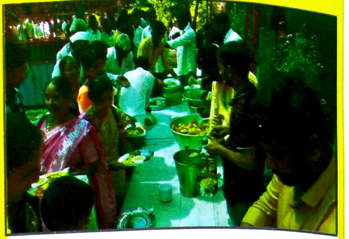
त्रिपुरारी पौर्णिमेच्या दिवशीचा दुपारचा महाप्रसाद कार्यक्रम..