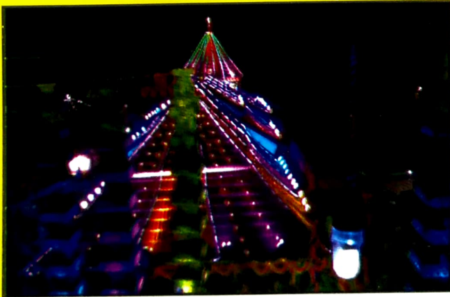
कार्तिकोत्सवातील मंदिर रोषणाई..