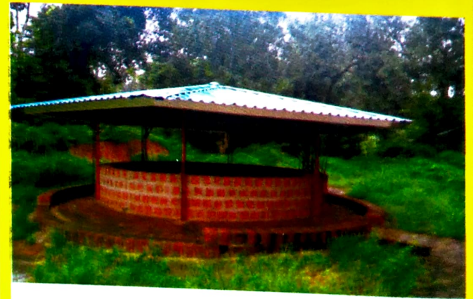
श्री देवाच्या मंदिराशेजारी बांधलेली नवीन गोलाकार विहीर... जलसंजीवनी...