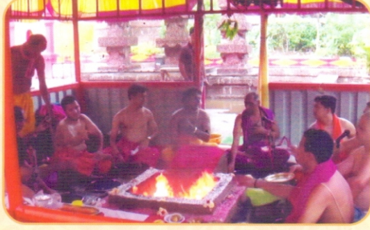
कार्तिकोत्सवातील लघुरुद्र स्वाहाकारातील क्षण.