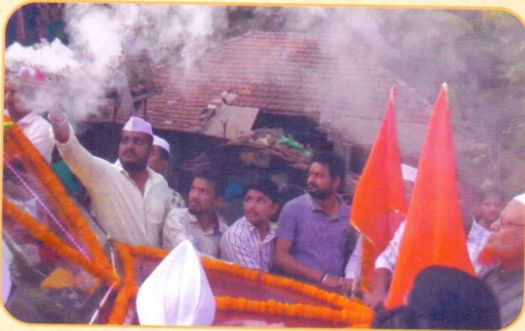
मिठगावणे मुस्लीम मुहल्ल्यामध्ये सुवर्णकलशाचे स्वागत करण्यात आले, तो क्षण.