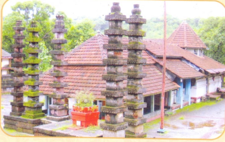
जागृत स्वयंभू श्रीदेव अंजनेश्वर, मिठगावणे मंदीर

मु.पो. मिठगावणे, ता. राजापूर, जि. रत्नागिरी - ४१६ ७०२