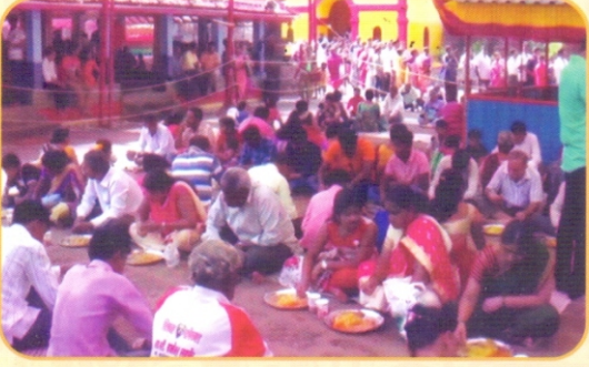
कार्तिकोत्सवातील समाराधनेचा कार्यक्रम, भोजनप्रसाद भक्षण करणारे भाविकभक्त.