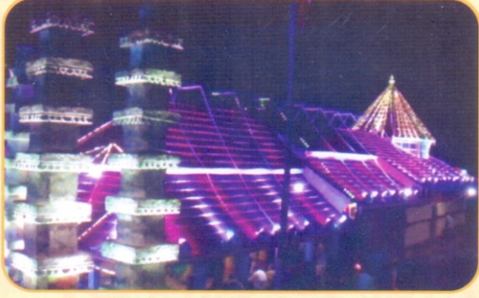
कार्तिकोत्सवातील मंदीरावरील रोषणाई.